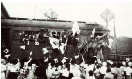
茨城県大塚駅での応召軍人見送り