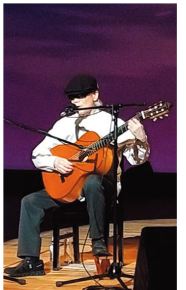
55周年記念コンサートで

年若いもお好きな仕事を続けられる人の姿は清々しい。今年、デビュー55周年を迎えたシンガーソングライター長谷川きよしの記念コンサートが、先月都内と神奈川県内で開かれた。