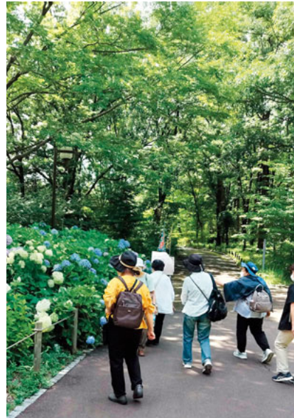
青空の下で心地よく

園内は「あじさい花まつり」と重なり、大勢の人でにぎわいを見せていました。前口までの雨で紫陽花の色が一段と深みを増し、さすが「雨に紫陽花」の感じでした。園