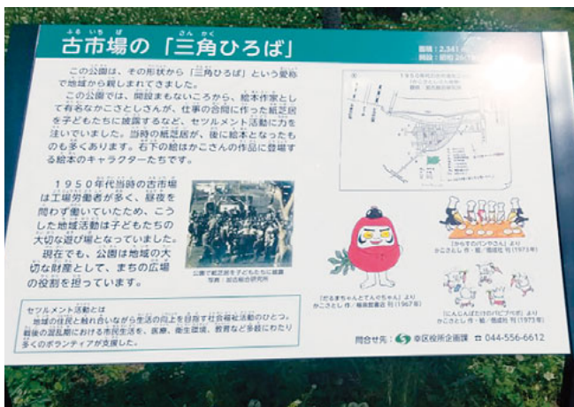
公園に設置されたプレート