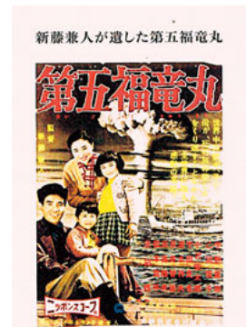
ブルーレイ付属の冊子

独立プロゆえ資金面でも苦しかったことなど、制作にあたっての苦労や舞台裏の話などが、ブルーレイ発売に伴って、新たに編集された冊子のなかで、新藤氏や関係者の言葉として紹介されています。