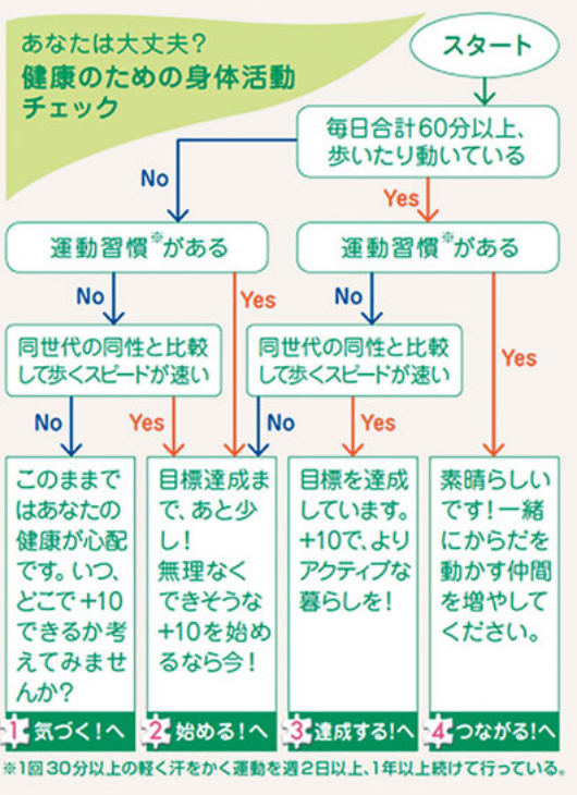
【図2】健康のための身体活動チェック