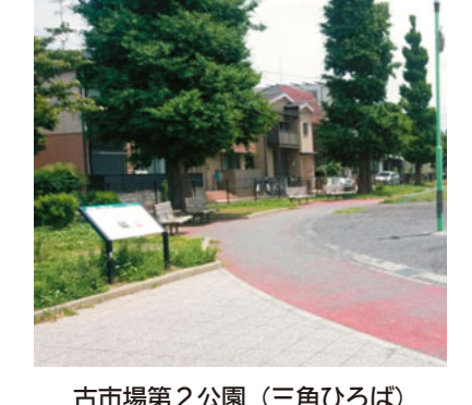
古市場第2公園 (三角ひろば)

「三角ひろば」は、幸区古市場にある川崎セツルメント診療所から徒歩5分で行ける公園です。