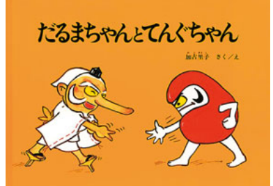
福音館書店 1100円(税込み)

だるまちゃんに見せると「いいものを見つけたね」と言ってくれました。しばらくすると次はてんぐちゃんの帽子がほしくなり、その次は履物がほしくなり、だるまちゃんはその度に工夫をして同じようなものを見つけます。そしてついにてんぐちゃんの鼻がほしくなっただるまちゃんはアイデアと工夫でステキな長い鼻を手に入れるのです。