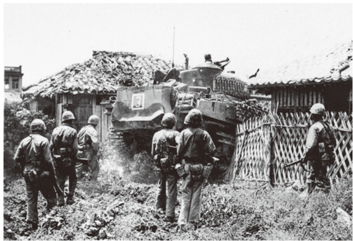
民家を破壊しながら進撃するアメリカ軍 (1945年米軍撮影)

明治大学平和教育登戸研究所資料館 (川崎市多摩区東三田1-1-1 明治大学生田キャンパス内)。