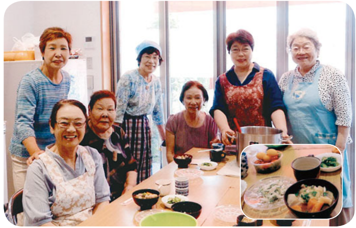
当時とは比べものにならないおいしいすいとんでした

7月すいとんを食べることにしました。健康づくり委員会の健康づくりで物知りで、一番元気で物知りで、すいとんを作った。