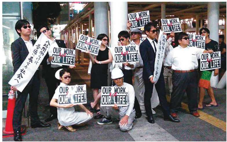
駅前に突然現れ、注目を集める

8月20日、JR川崎駅周辺で、来年の川崎メーデー90回をお祝いしようと神奈川県川土建一般労働組合や川崎合同法律事務所、川崎医療生協の有志12人が集まり「ワーカーズモブ」というデモンストレーションを実施しました。 当日は自分たちの仕事着のまま、「8時間働けば普通に暮らせる社会へ」、「患者も従事者も守れ 命!」、「守れ賃金守れ命!」、「OUR WORK for OUR LIFE!」と書かれたプラカードを持ち、マネキンのようにじっと立ったまま無言のデモンストレーションをしました。 5分程じっとして次の場所に移動。移動した先でもポーズを変えてまたじっとしたまま訴えるという「ワーカーズモブ」スタイルで街行く人に訴えました。通りすがりの若者が興味を持ったのか「カッコイイ!」と飛び入り参加したり、「その通り!」と訴えたり、「俺なんか今日16時間も働いた!」と訴えたりしていました。 12人の周りには人だかりができ、スマホで写真を撮られるなどかなりの人目を引きました。来年の「ワーカーズモブ」スタイルまで有志を募り、またお祝い企画を行っていただく参加者は意気込みを見せます。