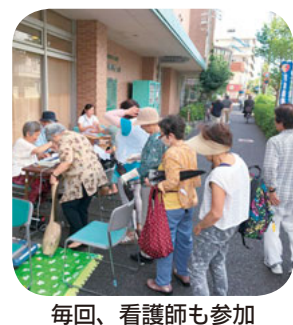
毎回、看護師も参加

藤崎南支部では、4月から10月の間、毎月1回「まちかど健康チェック」をふじさきクリニック前で開催しています。第3木曜日の10時から11時30分の間と短時間ですが、体操教室でクリニックを訪れた人などからは大好評です。