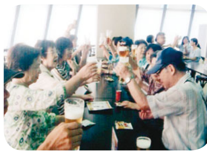
みんなでカンパニー！

見学は、毎年工夫されていて、行くたびに見学内容や説明方法が少しずつ変わっているのに驚きました。工場見学が終わり、参加者が待ちに待っていたビールの試飲がスタート。色々なビールの味を楽しみました。みんな赤い顔をしながら、工場敷地内にあるレストランでランチを食べました。