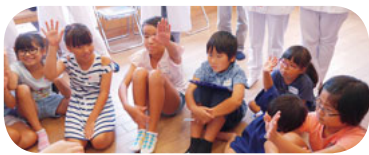
先生の話に興味津々

その後、あさお診療所が注射器を使い、どれだけの量のワクチンが体に入るのか、目に見える形で実験をしました。子どもたちは興味津々で医師が出す質問に耳を傾けていました。予防接種の勉強の後は診察室に移動して、エコーの検査体験や、企画をサポートする組合員が模擬患者になり子どもたちに診察してもらいました。