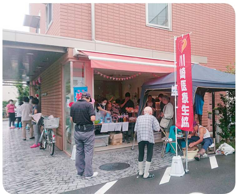
地域のつながりを求めふれあいカフェオープン

上平間のなかはら在宅サポートセンター（1階介護事業所、ふれあいルーム）、レインポールの家上平間（2階・3階のサービスパック高年齢者住宅）を地域の方に知ってもらおうと、ふれあいカフェ&バザーを8月8日に開催しました。台風による暴風雨の予報でしたが、当日は小雨程度で無事に開催できました。 組合員をはじめレインポールの家上平間相談員、かりん職員、介護事業所職員が協力して