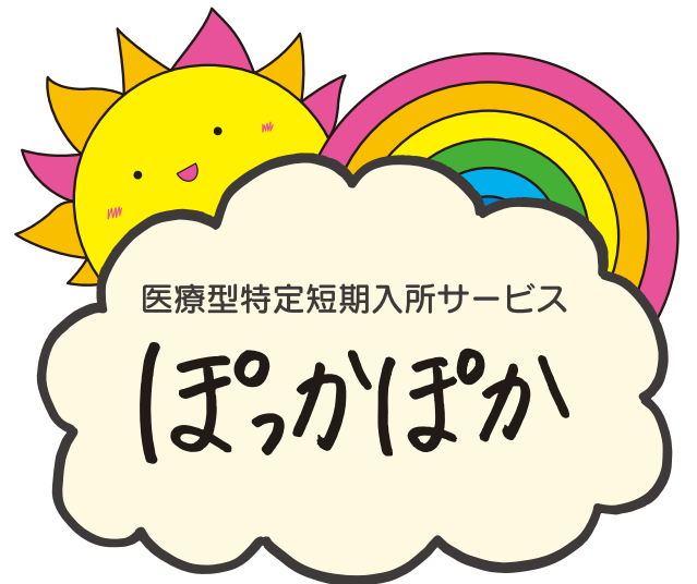
スタッフみんなで考えた施設のロゴマーク

ぽっかぽかを利用するのは、人工呼吸器をつけていたり、口から栄養を取ることができず、胃にチューブをつなげて栄養を補給したりするなど、身体的にも知的にも重度な障害を持つている重症心身障害児(者)です。月曜日から金曜日の午前9時30分から午後5時まで預かり、医師や看護師、介護、リハビリスタッフが必要な支援をします。