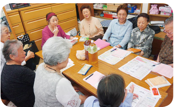
健康第1、おしゃべりも弾む

毎月開催している班会のテーマは健康に関するものが多く、体年齢や体脂肪率、推定骨量などがわかる体組成チェックを年に4回、転倒予防のパロメーターにもなる足の指の力をチェックする足指力チェックを年に2回実施しています。このほか講師を招いて体操を行ったり、希望する班員で協同病院に乳がん検診を受けに行ったりすることも班会のひとつにしています。