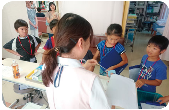
いつもは見えないところも探検

その後、しんりよう所の中のけんさ室を順番にたんけんしました。レントゲン室ではぎしの人がスマホにレントゲンを当てて中のこうぞうを見せてくれました。ぼくは熱中しようになってしまったのか少し気分が悪かったので、ベッドでねかせてもらいました。その間に、友達はエコー室で自分のぼうこうとじんぞうを見たそうでした。