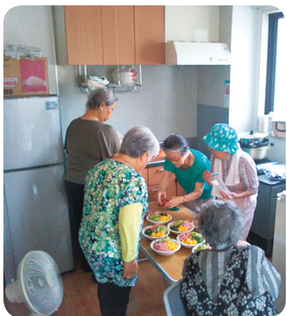
広がった組合員ルームにウキウキ