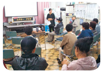
映画で昔の思い出がよみがえる

台風で延期していた映画「シアターアサダ」が9月29日に京町診療所内で開催され、夏目雅子の遺作「瀬戸内少年野球団」を上映しました。戦争で人生を狂わされた苦悩と混乱期をたくましく生きる人々の姿を描いた作品で、困難を乗り越えて子供たちに野球を教える、小学校教師を夏目雅子が演じていました。