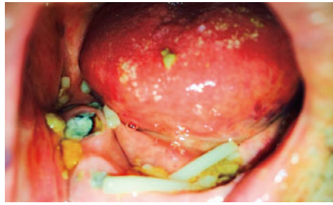
食事がうまく食べられない

災害には、地震・津波・台風などの自然災害や大規模な事故などによるものがあり、被害が甚大な場合は避難所生活を余儀なくされます。災害時は、まず命に関わる救命救急への対応が優先されますが、避難生活が長引くと、歯磨きなどの口腔ケアが重要になります。