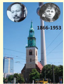
舞姫の舞台となったベルリンのマリエン教会

鷗外は6歳で養老館(藩校)に入学して『論語』や『孟子』を読み、家では父親からオランダ語を学び、周囲から将来を嘱望されて育ちました。10歳で父と一緒に上京して医学学校進学のためにドイツ語を学び、12歳の時に年齢を2歳水増しして医学学校予科に入学しました。やがて本科に進み1881年に東京大学医学部を卒業しました。 医学生時代には多くの書物を読み、漢学や和歌を学びました。それほど優秀で上昇志向の強かった鷗外ですが、卒業時の成績は28人中8番でした。鷗外は留学を希望していましたが、成績上位1、2番だけが文部省の国費で海外留学できたので、その夢は絶たれてしまいました。 卒業後は父の開業を手伝っていましたが、見るに堪えかねた友人のすすめで陸軍省に入学し、やがてドイツ留学の機会を得ます。1884年から1888年までの4年ドイツから帰国後、ドイツ留学からの帰国後、陸軍省の任務に付きましたが、この頃より文筆活動が始まりました。 1889年に『小説論』を発表し、外国文学の翻訳も手がけました。またのちにドイツ三部作と呼ばれる『舞姫』(1890)、『うたかたの記』(1890)、『文