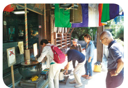
まずはおまいりして

東小田支部では、9月19日に6人が参加し、世田谷区瀬田にある玉川大師に行ってきました。幸いにも天候に恵まれ、快晴のもと田園都市線の二子玉川駅で下車しました。