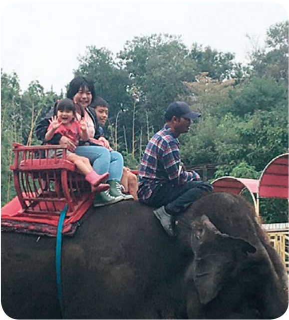
ぞうの背の上でゆられて

観音支部主催のバスハイクが9月30日、雨模様のなか開催されました。バスは7時30分定刻通りに出発。バスの中では、毎年恒例の「ピング大会」が開催され、気分を盛り上げながら市原ぞうの国へ到着。そして、バスを降りてみると予報とは違って雨は上がっていました。参加者の日頃の行いが良いのか、ぞうさんショーは無事に行われ、エサやりや、ぞうさんの背に乗ることもできました。