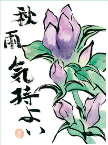
川崎区 三浦 サチ子