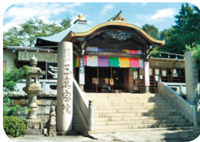
都会の中とは思えない静けさ

ハイカラな店が並ぶ商店街を抜けて15分程歩くと都会とは思えない静かな所でした。本堂にあがってから地下霊場に入ると真つ暗闇の世界で怖かったです。恐る恐る手探りしながら、所どころにある石仏を拝みました。あまりにたくさんいるような感じにもなりました。帰りは高島屋でランチを食べて帰路につきました。