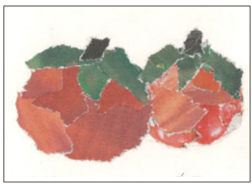
川崎区 山下 なを子

川崎区 山口暢(45) みんなで川柳によく知っている名前がいつも載っています。 今度、私も投稿して見ようかな(笑)