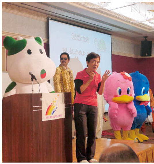
各生協のキャラクターたちも勢ぞろい

10月11日、横浜市中区にあるワークピア横浜で毎年恒例の生協大会が開催、32団体311人が集まりました。この大会は1969年から毎年開催され、その時々の暮らしのテーマを掲げ、また、購買生協など県内の生協や協同組合の交流の場に