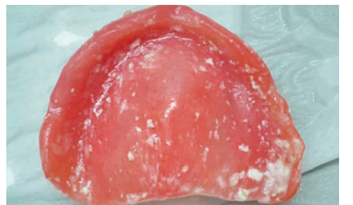
義歯に食べかすが残ってしまう

阪神・淡路大震災では、震災関連死(災害の直接被害ではなく発病や持病の悪化などにより死亡する)のうち24・2%が肺炎だったという報告がありました。(東日本大震災では31・2%)慣れない避難所生活での食事の偏り、ストレスによる抵抗力の低下、インフルエンザの蔓延とともに水不足により口腔ケアができなかったことが、誤嚥性肺炎の発生につながった可能性があります。