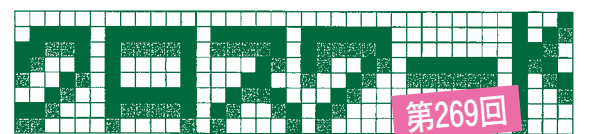
《解き方》イラストをヒントにして、二重ワクの6文字をうまく並べてできる言葉は?