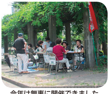
今年は無事に開催できました

7月に暑さのために延期し、再びチャレンジしたさいわい緑道での健康チェックでしたが、今回は、さわやかな秋空の下で無事に