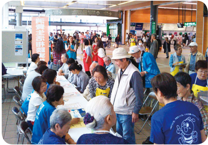
昨年をこえる人が健康チェックに

10月8日、体育の日に溝の口駅南北自由通路で、第54回川崎市消費生活展が開催されました。暮らしに役立つヒントがいろいろある「つばい」のテーマで川崎市内のさまざまな消費者団体や生活協同組合が趣向をこらした展示などで盛り上げていました。私たち川崎医療生協も 10月8日、体育の日に溝の口駅南北自由通路で、第54回川崎市消費生活展が開催されました。暮らしに役立つヒントがいろいろある「つばい」のテーマで川崎市内のさまざまな消費者団体や生活協同組合が趣向をこらした展示などで盛り上げていました。私たち川崎医療生協も