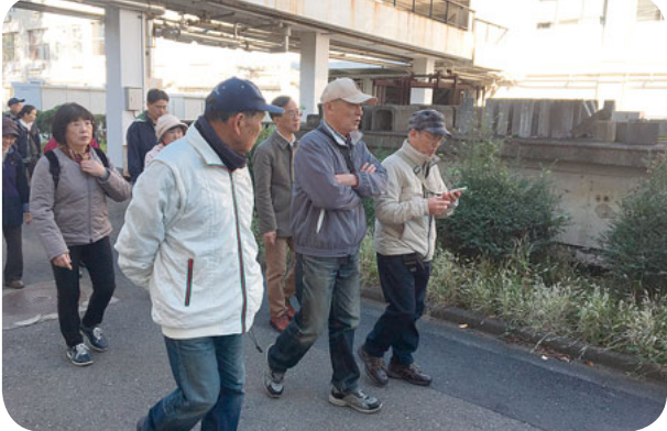
戦争遺跡見学に参加。久しぶりに屋外での班会