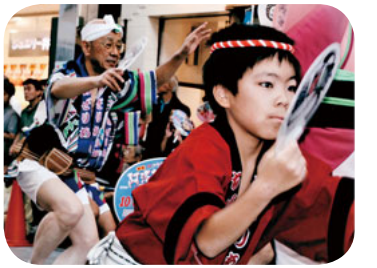
子どももおどって

今年も「かわさき阿波の写真班の班会では、阿波どり」(同実行委員会 波おどりの子どもと大人主催)が開かれ、地元からたちの見事なA4サイズらと招待の人を含めて約620人が川崎駅西口周辺を練り歩きました。大