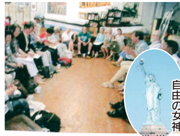
ニューヨーク平和団体と交流

前に。ホテル、銀行、不動産業など業務。ハドソン川の河口に堂々と建つ「自由の女神」。高さ100メートル。フェリーで遠まき