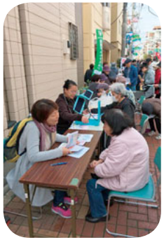
看護師さんが説明

11月18日(土)から19日(日)にかけて、川崎近隣の協同病院で健康チェックを受けました。