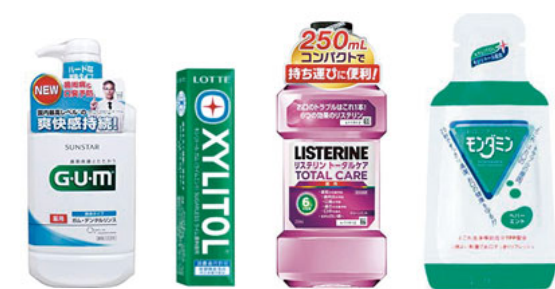
水がない時に液体ハミガキやガムも

①歯ブラシ。2〜3本持っておくといでしょう。②布・ハンカチや口腔ケア用品。殺菌成分のある液体ハミガキを使うことでお口の