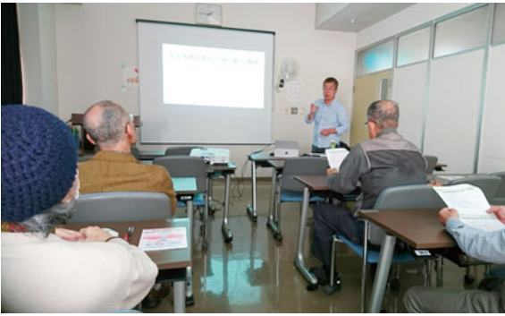
講義を熱心に聞く医療生協組員

川崎医療生協の社会保障委員会が主催する社保学校が11月16日からスタートしました。社保学校は全5講座からなり、社会保障の考え方や歴史、医療・介護、年金、生活保護などの制度についても学ぶことになっ