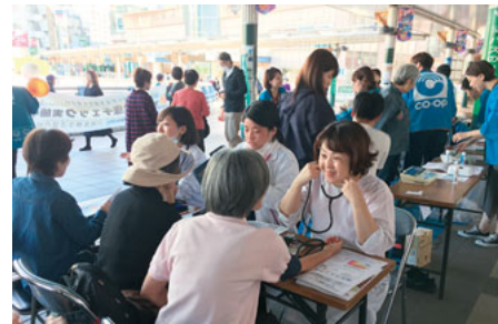
ましかど健康チェックは大にぎわい

地域での活動を通して、職員としての役割を考えようと、10月29日、川崎医療生協2年目職員の研修が実施されました。近年職員が地域で活動することが少なくなっているなか、地域に出ることを医療生協の職員として大事にしよう、医療生協の活動に主体的に関わることで自分たちの役割はなんなのか考えようという、法人の教育委員会の方針のもと、2015年度からはじまりました。