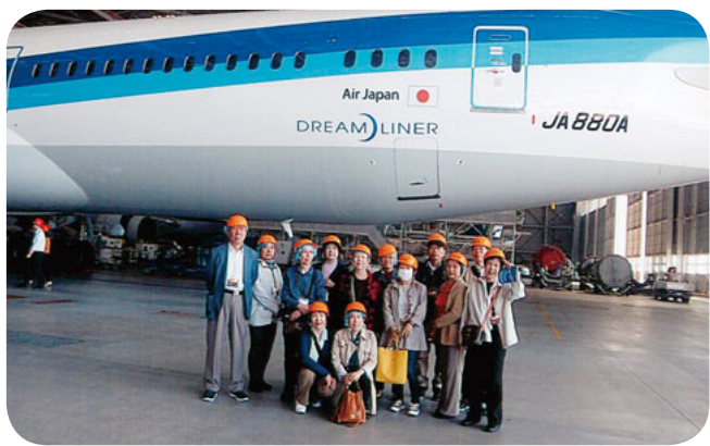
飛行機の大きさにビックリ 機体の前でみんな揃って

10月22日午前8時40分、京急川崎駅に集合、京町支部の主幹が案内しました。ANA機体工場見学に行きました。工場内を見学でき、また違った工場内を見学でき、楽しかったです。間近で見る飛行機の大きさに驚き、整備工場内の大きなエンジンやタイヤ、飛行機の椅子などがたくさん並んでいる間を通り抜けながら見学しました。また工場内では大勢の整備士が働いていました。工場内が広いので、整備士