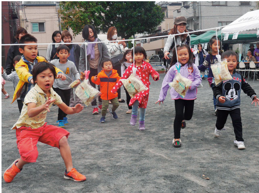
パン食い競争は今年も白熱！セツルメント診療所、ふれあい健康まつりで

全国の医療生協（日本医療福祉生活協同組合連合会）では、毎年10～11月を「生協強化月間」として、組合員や出資金を増やし、新しい班づくりやより多くの医療生協の新聞配付者を募る活動に力を入れています。川崎医療生協では、今年から医療生協をもっと多くの人に認知してもらおうと「知ってもらおうキャンペーン」を展開し、さらに新たな「仲間」を募っています。 （編集長 城谷創一）