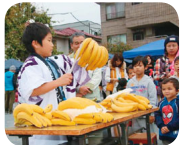
おいしいバナナだよ

幸区川崎セツルメント診療所近くの古市場第5公園で11月4日に『第23回ふれあい健康まつり』が開かれました。中部建設青年部有志による太鼓演奏からはじまり、今年注目は、古市場小学5年生による「バナナのたたき売り」です。お客さんとの掛け合いもなかなか上手で、なかには看護小規模多機能の利用者さんやみよびの利用者さんも参加しておおいに盛り上がりしました。また、鹿島田商店街にあるティーンズダンスルームから、3グループ20人がキッズダンスを披露、小さいダンサーにたくさん拍手があげられました。子どもコーナーではベীগマまわし・輪投げ・ボールアートを準備。ボールアートコーナーには長い行列ができていました。昼頃から、雨模様となりましたが、楽しい秋の日を過ごすことができました。古向支部 坂内亮 多摩川河川敷で毎朝行っている太極拳グループ「日の出会」のみなさんの演舞、ミニ運動会、健康体操、トランペットの演奏が行われました。 おいしいバナナだよ