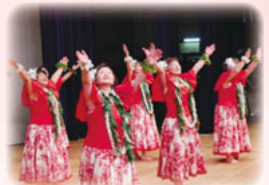
昨年の舞台上披露されたフラダンス