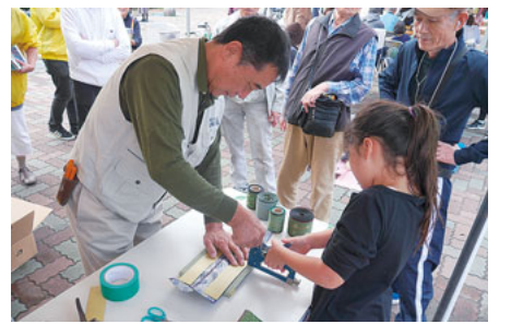
ミニ豊づくりが人気、大師ふれあいまつり

セツルメント診療所周辺地域で行われた「ふれあい健康まつり」には、近くのダンス教室の子どもたちおよそ20人が初めて参加し、お祭りを盛り上げました。