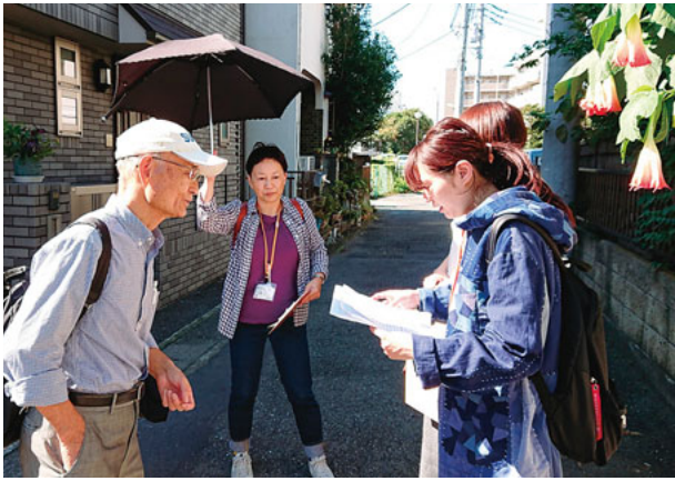
組合員を訪ね、言葉を交わす職員たち

参加した職員からは、「組合員さんとの訪問行動を通じて、病院へいってお金を払ってまで相談すべきなのかな」と思っている人も多くいたという報告もありました。