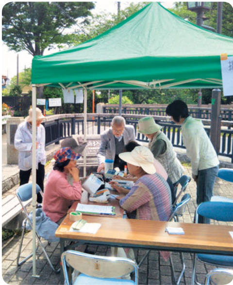
次は緑化センターまつりの日にやるよ!

5月18日、暑いから太陽の下、多摩区宿河原の八幡下橋で健康チェックを行いました。今回は体組成・血圧・握力を無料で、20人がチェックしました。握力は久しぶりにチェックした人が多く、みなさんその結果に一喜一憂していました。 初めて体組成をチェックしたという男性からは、「次はいつこ