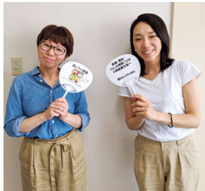
健康診断と増資にご協力を

川崎医療生協では6月から7月にかけて「健康診断スタート&事業所パワーアップ月間」を開催中。組合員や地域の方に健康診断の受診をすすめることや、坂戸診療所のリニューアルや他の病院・診療所で医療機器の購入など、地域の健康を守るための設備の整備をすすめています。