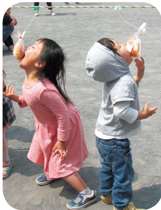
毎年パン食い競争は大盛況!

4月21日、第7回協同地域健康まつりが開催されました。今年の模擬店舗数は23、テントの数は30となり、昨年に引き続き盛大なおまつりとなりました。今年、主催側が誘ったこともあり、かわさき生活クラブ生協もブースを出し、試飲や試食が行われました。 午前11時の開会に向けて和太鼓の演奏が始まると、来場者が増え、いき最終的には750〜800人ほどが集まり、大にぎわいとなりました。 健康まつりの名物となっているのが、子どもたち限定の「パン食い競争」。昨年はパンを50個用意したところが足りず、参加できずに泣いてしまっ子がいいたので、今年は70個用意しました。それでも、希望者全員が参加できないほど人気の企画となりました。 健康チェックコーナーも毎年大人気で、たくさんの方が利用しました。 健康まつり実行委員会 澁谷 正行