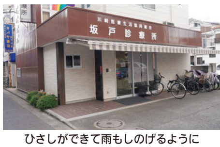
ひさしができて雨もしのげるように

患者さんからは「車いすで診療所に行ったが、トイレが使用できず、我慢して家に帰りました」という意見がありました。財政難のため今は診療所全体のリニューアルができないのであれば、「せめても車いすで使用