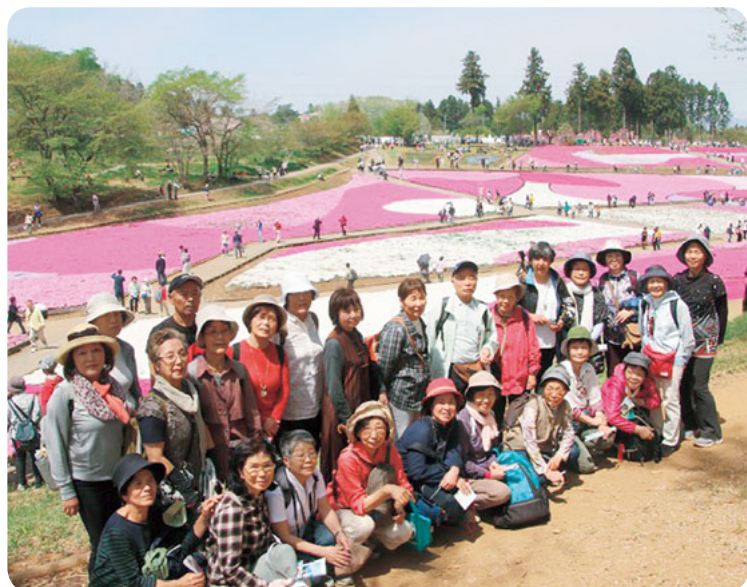
満開の芝桜の中をハイキングして

4月23日古向支部はハイキングで芝桜満開の秩父羊山公園(埼玉県秩父市)へ行ってきました。今回はよこはま健康友の会のみなさんとも合同で、総勢27人の大部隊、途中行方不明者も出るなどハイキングもありましたが、満開の芝桜を堪能してきました。 昨年からの古向支部のハイキングは三浦半島を中心に6回企画され、のべで94人が参加しました。夏は企