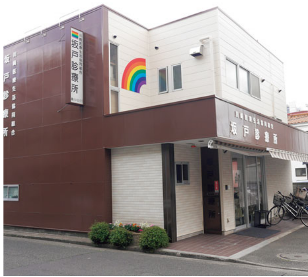
虹のマークも大きくくっきりと

が、診療所を利用するにあたって、患者さんにアンケートを実施したのがきっかけでした。