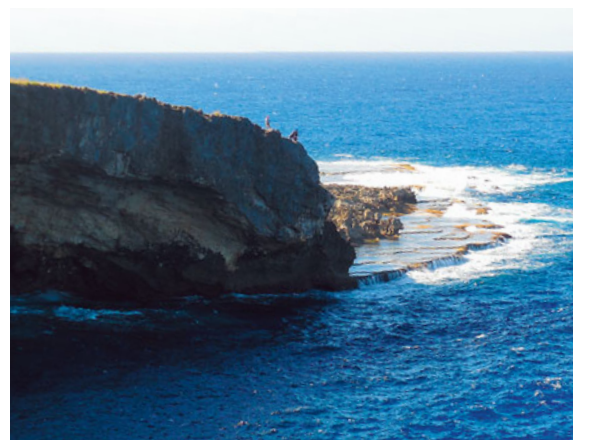
バンザイクリフ (サイパン)