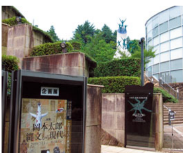
太郎ワールドに潜入

「川崎宙と緑の科学館」は、自然・科学・天文の3つが体験できる博物館です。川崎市の自然を「大地」「丘陵」「多摩川」「街」「生