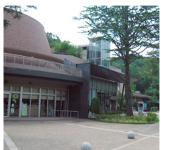
プラネタリウムは必見