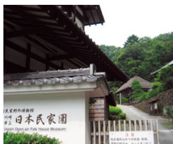
重要文化財をみられる民家園

東西に約31km、南北に約19km。東京と横浜に挟まれた東西に細長い川崎市は、内陸の北側と海側の南では街の風景もかなり違います。そんな川崎のなかで、知られざる見どころを紹介していきます。第4回は、緑地公園としては市内最大の面積(約30万坪)をもつ生田緑地と、その中の施設を紹介します(理事 山岸洋一)。