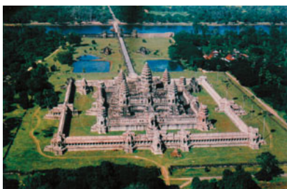
アンコールワットの全景