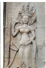
デバター(女神) 東洋のヴィーナス