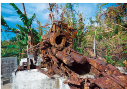
サイパン空港近くの戦跡

サイパン国際空港は、戦時中日本海軍の第1飛行場だった。米軍占領後は日本本土へのB29の発進基地となり、1945年3月10日の東京大空襲等もここからB29は飛び立った。