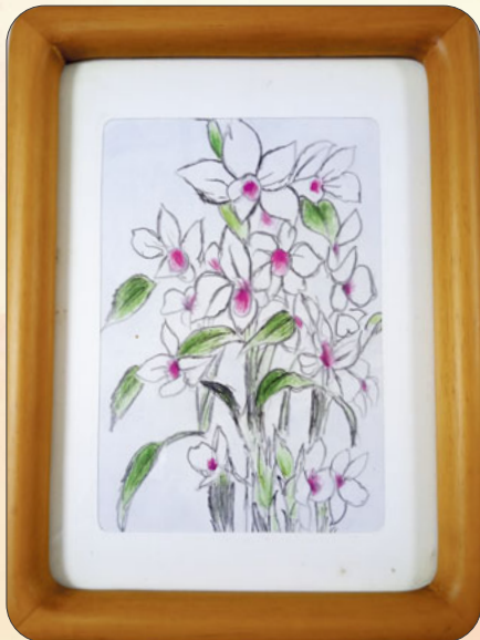
色エンピツ画 デンドロジウム