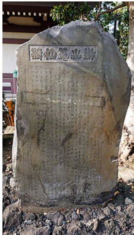
川崎大師境内にある遊山慕仙詩碑

葉公珍仮借 秦鏡照真相 鴉目唯看腐 狗心耽穢香 人皆美蘇合 愛縛似蝶娘 仁恤麒麟異 迷方似犬羊 能言若鸚鵡 如說避賢良 豺狼逐麋鹿 狡子嚼麀羶 睡毗能寒暑 劇談受瘡瘡 營營染白黑 讚毀織災殃 肚裏蜂蠶滿 身上虎豹狂 能銷金與石 誰顧誠剛強