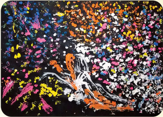
スパッタリング ドンと鳴った花火