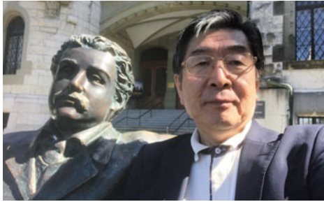
若きアインシュタインと（ベルン.2018）

事を求め、T社の医用電子事業部に就職しました。携わったのは体表面心電図の簡易装置の研究、自動車連