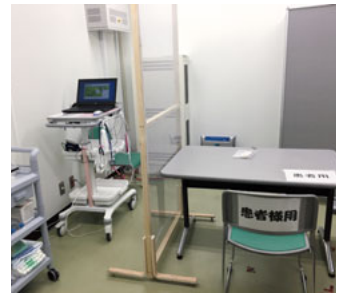
協同病院の発熱外来

川崎医療生協の病院や診療所では、連携しながら発熱患者の診療を積極的に行っています。感染対策上、協同病院では整備された隔離