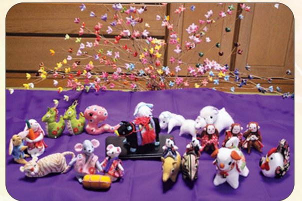
吊るし飾り 十二支とちりめん小花