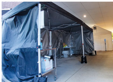
協同ふじさきクリニックの発熱外来

新型コロナウイルスの感染を防ぐには、このウイルスがどのように入ってくるのかを知る必要があります。新型コロナウイルスは、目・鼻・口といった粘膜から体内に侵入し、感染を起します。