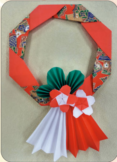
折り紙 しめ飾り 浅田支部 ひまわり班