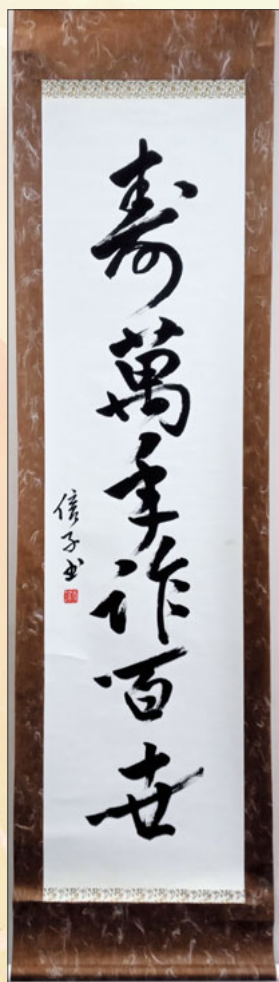
掛け軸 「寿萬年作百世」