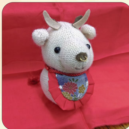
干支のぬいぐるみ