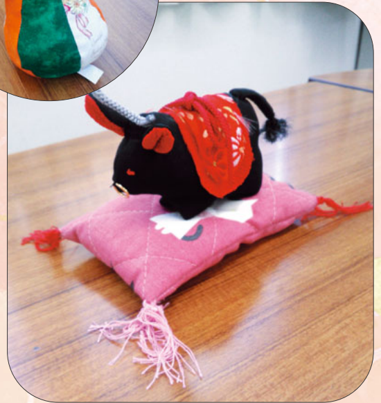
吊るし飾り 丑と茄子