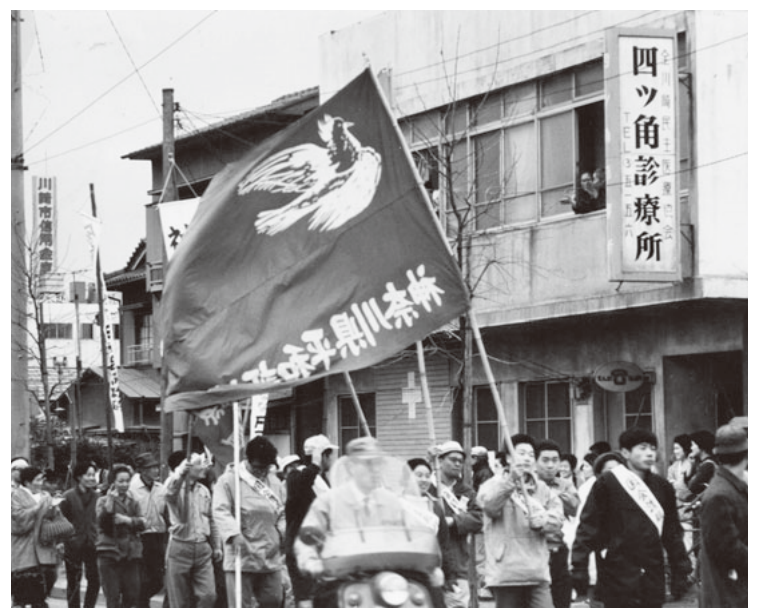
協同病院へと発展していく川崎区大島にあった四ツ角診療所

1951年9月に東京大学の学生や医師などのセツルメント活動のメンバーと、日本鋼管(現在JFE)が参加して、1973年7月に川崎医療生協に合流し、1986年3月に、現在の場所に移転、新築されました。