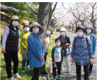
みんなで楽しくウォーキング

津田山へ戻り、公園の桜の下でそれぞれ持参した昼食を食べました。その後はドラえもんのおもいで楽しくウォーキング