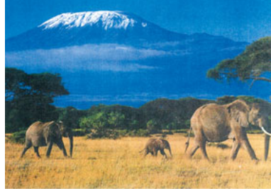
キリマンジャロの雪と象たち

キリマンジャロはアフリカ大陸のシンボルだ。が今氷河が毎年50センチずつ後退しているという。地球温暖化が影響している。