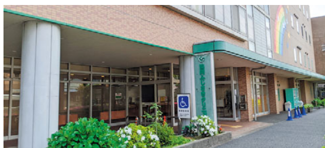
壁の色も組合員と考えた協同ふじさきクリニック

川崎医療生協では、協同病院の外來部門を担う新しい診療所建設のために2002年3月に川崎区藤崎に土地を購入。その後、気管内チューブ除去・薬剤投与事件や資金ショート危機などがありましたが、2003年の臨時総代会で、建設の必要性を確認して着工することを決め2004年8月から工事が始まりました。