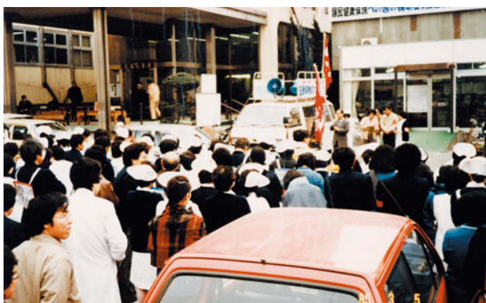
ボーリング場を改築して建てた協同病院

協同病院建設にあたっては、川崎市内の全銀行に融資を申し入れましたが、担保不足を理由に断られたため、組合員や地域住民に出資金と組合員債を呼びかけ8億5900万円を集めました。この時、地域住民、中でも在日朝鮮の人たちの大きな力添えがありました。当時の新聞には「みんなの病院ができた」「公害病に空気清浄室」などと大きく掲載されました。1990年から増改築をすすめて、92年4月に第一期棟が完成、93年3月に第二期棟が完成、94年5月には新しい川崎協同病院が完成しました。