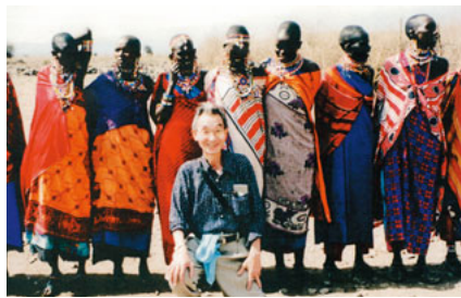
アフリカの貴族マサイ族といっしょに

地から独立。初代大統領はケニヤッタ。政治は比較的安定。ナイロビの国立博物館は人類祖先の化石が展示され圧巻だ。