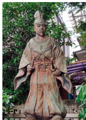
新田義貞像が境内に

川崎東口バスターミナルから、臨港バス「川21・川22・川23系統」いずれかのバスに乗り、「さつき橋」で降りたら、バス通りの反対側へと渡り、川崎駅方面を背にするように進んで、川崎信用金庫渡田支店の手前を右折。5分ほど道なりに進むと右手に新田神社があります。入口には黒の石に赤い文字で「新田神社」とかかれた石碑があり、その奥に鳥居と大きな木々に囲まれた社殿が見えます。周りの住宅街とは違って変わって神聖な雰囲気です。