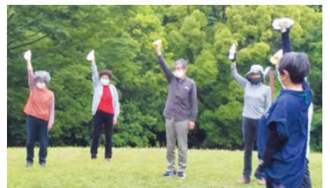
広い芝生の上でストレッチ

参加者24人が広い芝生の上で、関節を曲げたり伸ばしたり、筋力の低下を防ぐストレッチを行いました。また、王禅寺では歴史にも触れ、公園外周散策路でショートウォーキングを楽しみました。次回のストレッチ教室も、王禅寺ふるさと公園で行います。ペットボトルを使って、コロナ禍で衰えやすい筋肉を、ゆる