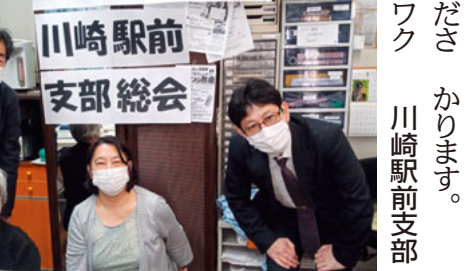
繋がりの大切さを感じた総会

昼食の後、東急多摩川線「多摩川駅」で解散、5人は大田区側の土手を歩いて帰宅し5人は電車で帰宅しました。新緑の中、天候にも恵まれて気持ちのいい一日でした。