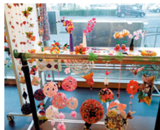
作品がたくさん並びました

展示の準備にかりまです。みなさんに素敵だね、可愛いね、と言われるのを励みに作品作りががんばっています。