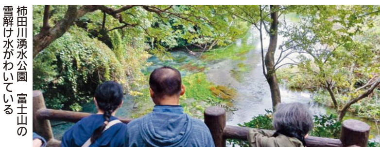
柿田川湧水公園 富士山の雪解け水がわいている