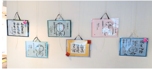
組合員の力作が並ぶ

浅田支部の「ばあばとじいじの手習い班」は、書道を愛する仲間です。みなさん書道経験は長いのですが、基礎から学び直すのも面白いのではないかと「教本で手習いをする」というのが班名の由来です。初めに立ち返って稽古の成果を広く見てもらおうと、12月28日まで、京町診療所横のコスモ薬局の「ふれあいルーム」で書道展を開催しています。