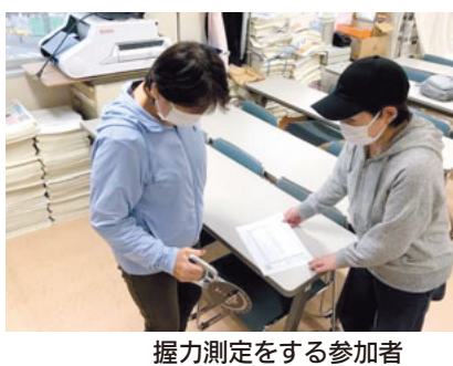
握力測定をする参加者