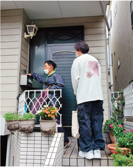
案内役として職員と組合員宅を訪問