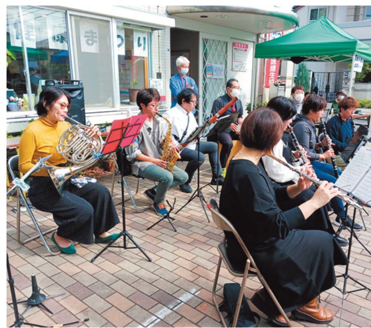
注目を集めたKMC ブラスバンド

棒反射、椅子スクワット、片足立ちなどのおもしろ体力チェックや、全身の筋力の程度を知る指標にもなる握力チェックをはじめ看護師による血圧チェックや健康相談が行われました。