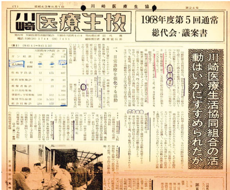
1968年5月1日発行の第24号

本紙、川崎医療生協新聞は、今月で700号を迎えます。1966年の創刊から今日まで、多くの組合員が発行から配付までを担い、地域に根ざした団体が発行する新聞としては異彩を放っていました。本紙の歴史と紙面制作から配付までのしくみなどを紹介します。