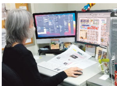
紙面のレイアウトをする(きかんし印刷)