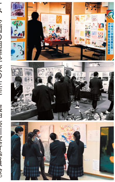
鑑賞学習に訪れた生徒ら(前回まで)

なり、本が読めない、歌が歌えない、理科の実験は一度もやったことがありません。松代あたりで穴を掘っている(松代大本営)との噂が入ったのはこの頃です。学校の授業は様変わりしました。先生から稲や藁を持ってくるように言われましたが、家が農家ではないので、近所から分けてもらったのを覚えています。その稲や藁を持って行くと、草履や俵作りを教わりました。養蚕が盛んで、秋には桑の木の枝を落とし、木の皮をむく授業がありました。その皮から軍服を作るのでした。海軍の救命具に入れるすずきの綿集めもありました。同じ頃、夫が徴兵された農家を手伝