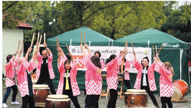
かっぱいしの和太鼓のパフォーマンス

健康チェックでは、医学部で学ぶ奨学生が手伝いに駆けつけ、健康チェックやその結果説明で活躍しました。また、福祉協同サービスは、トルトという歩行分析ソフトを利用した歩行チェックを行いました。参加者からは「久しぶりのま