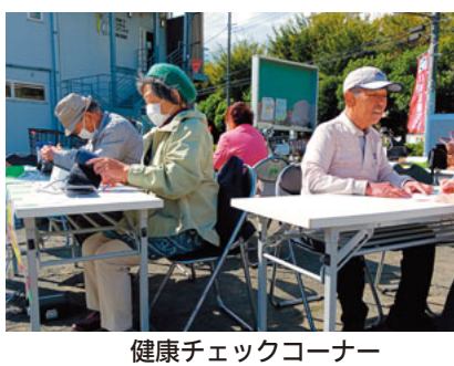
健康チェックコーナー